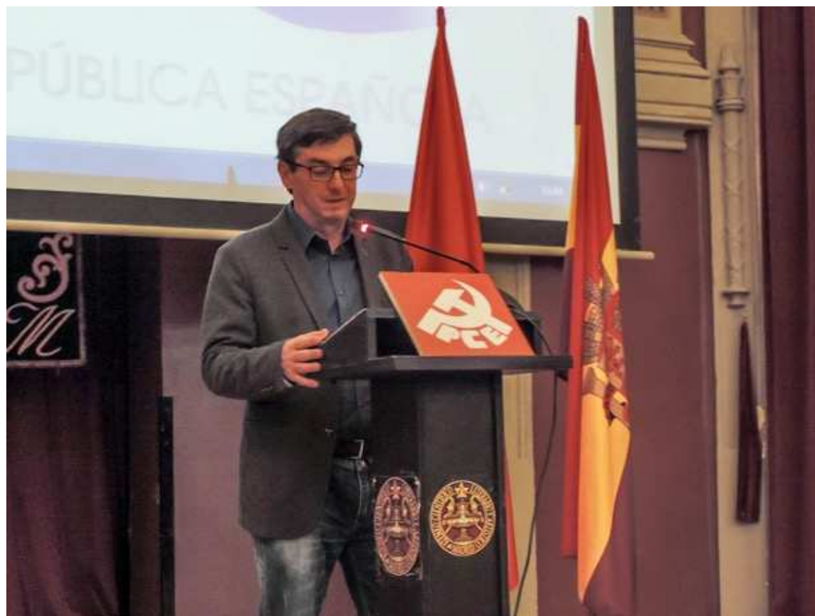
El PCE celebra

hoy el 85 aniversario de la República en todo el Estado español